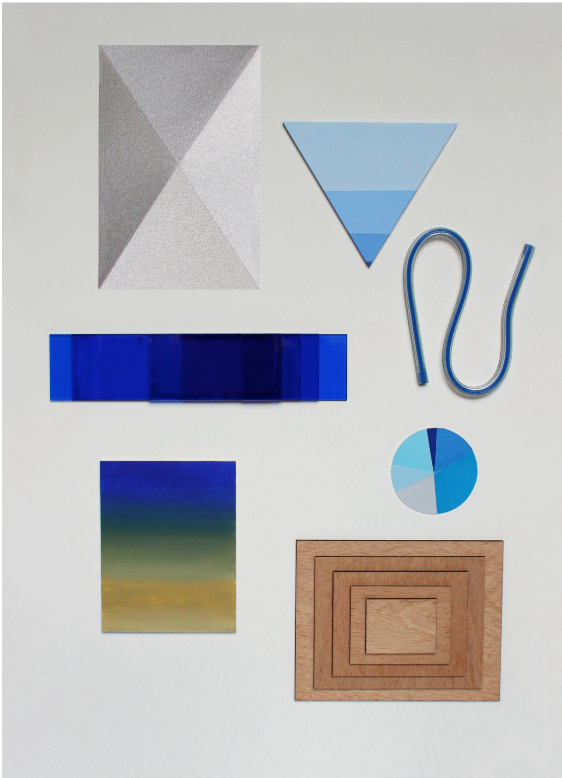
Sin título , 2016. De la serie Instrumental . Acrílico, pintura, plástico, aluminio, madera y papel sobre MDF. 70 x 50 cm