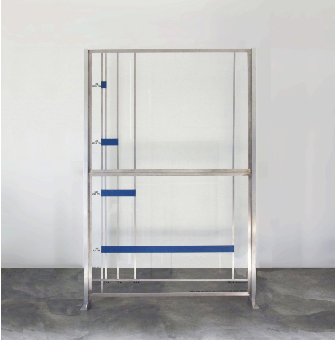
Mise à nu , 2017. Acero, aluminio y vidrio. 277,5 x 178 x 8 cm

Henrique Faria Buenos Aires Libertad 1628 - Buenos Aires 1016 Tel.: + 54 11 4813 3251